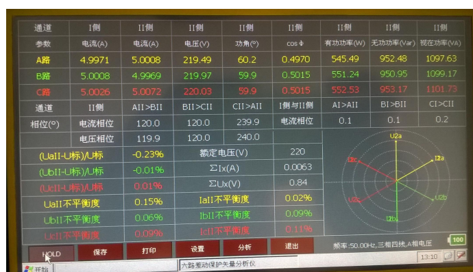
图四 HOLD 模式界面