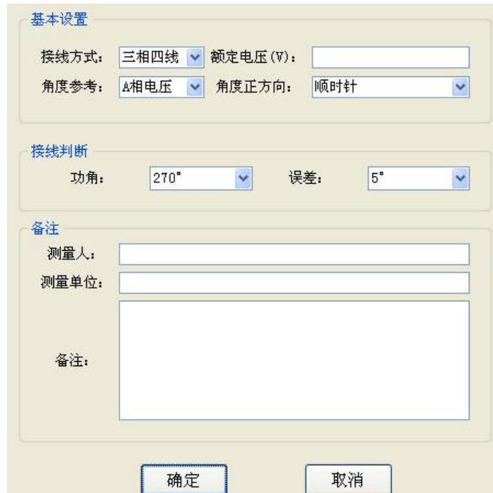
图六、信息设置界面